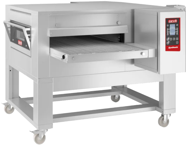
MODEL: SYNTHESIS 11/65 GAS/MC DIG