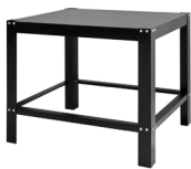
STAND SG GAS Oven Stand