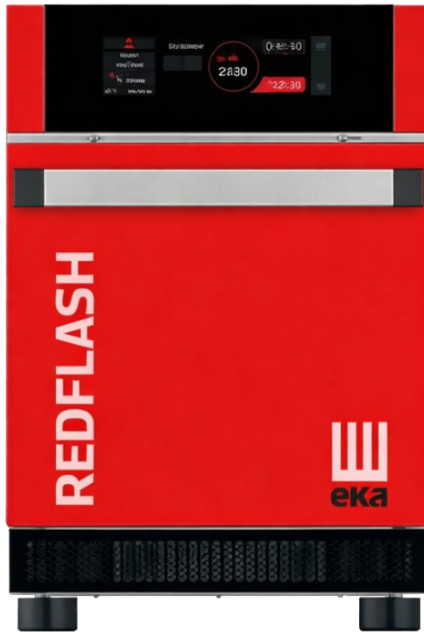
RFKFM3030R = Red colour

Tecnoeka Redflash 300 adalah speed oven elektrik berkapasitas 1 tray 300 × 300 mm yang dirancang untuk proses fast cooking dengan kombinasi dual magnetron, impingement cooking technology, dan direct humidification. Unit ini menggunakan multilingual touch screen control panel, mendukung 50 program (expandable to 250), serta bekerja pada rentang suhu 50 ÷ 270°C. Dengan dimensi 420 × 633 × 630 mm, unit ini sesuai untuk area kerja dengan keterbatasan ruang dan aplikasi layanan makanan berkecepatan tinggi seperti hotel, food court, fast food, sandwich shop, bar, pub, kiosk, stasiun, dan bandara.