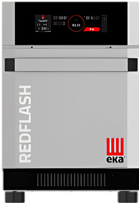
RFKFM3030 = Inox colour

Tecnoeka Redflash 300 adalah speed oven elektrik berkapasitas 1 tray 300 × 300 mm yang dirancang untuk proses fast cooking dengan kombinasi dual magnetron, impingement cooking technology, dan direct humidification. Unit ini menggunakan multilingual touch screen control panel, mendukung 50 program (expandable to 250), serta bekerja pada rentang suhu 50 ÷ 270°C. Dengan dimensi 420 × 633 × 630 mm, unit ini sesuai untuk area kerja dengan keterbatasan ruang dan aplikasi layanan makanan berkecepatan tinggi seperti hotel, food court, fast food, sandwich shop, bar, pub, kiosk, stasiun, dan bandara.