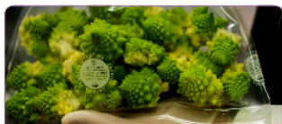
KOMPATIBEL DENGAN PLASTIK PEMBUNGKUS TIPE SMOOTH