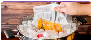
KOMPATIBEL DENGAN PLASTIK PEMBUNGKUS TIPE EMOSED