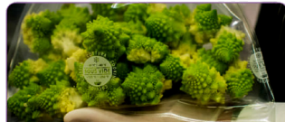
KOMPATIBEL DENGAN PLASTIK PEMBUNGKUS TIPE SMOOTH