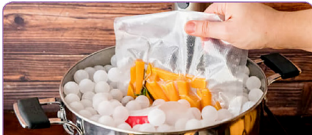
KOMPATIBEL DENGAN PLASTIK PEMBUNGKUS TIPE EMBOSD