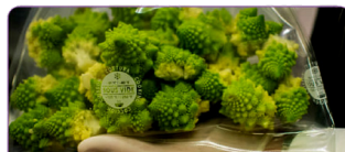
KOMPATIBEL DENGAN PLASTIK PEMBUNGKUS TIPE SMOOTH