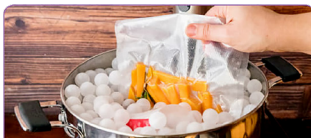
KOMPATIBEL DENGAN PLASTIK PEMBUNGKUS TIPE EMBOSED