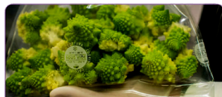
KOMPATIBEL DENGAN PLASTIK PEMBUNGKUS TIPE SMOOTH