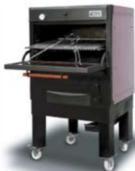
PIRA-130 (120 COVERS)