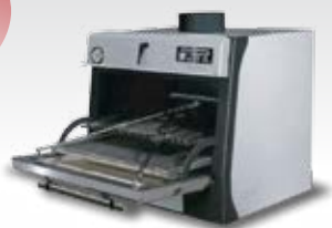
PIRA-45 LUX (90 COVERS)