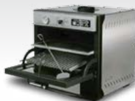
PIRA-50 (120 COVERS)