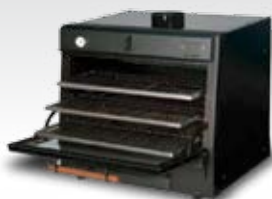
PIRA-48 (100 COVERS)