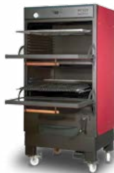
PIRA-170 (150 COVERS)