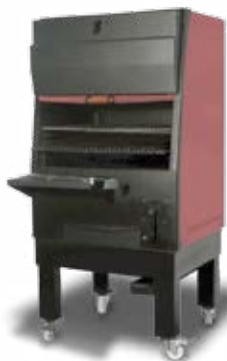
PIRA-130G (120 COVERS)